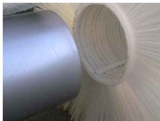
耳が付いていない方をブラシに当て